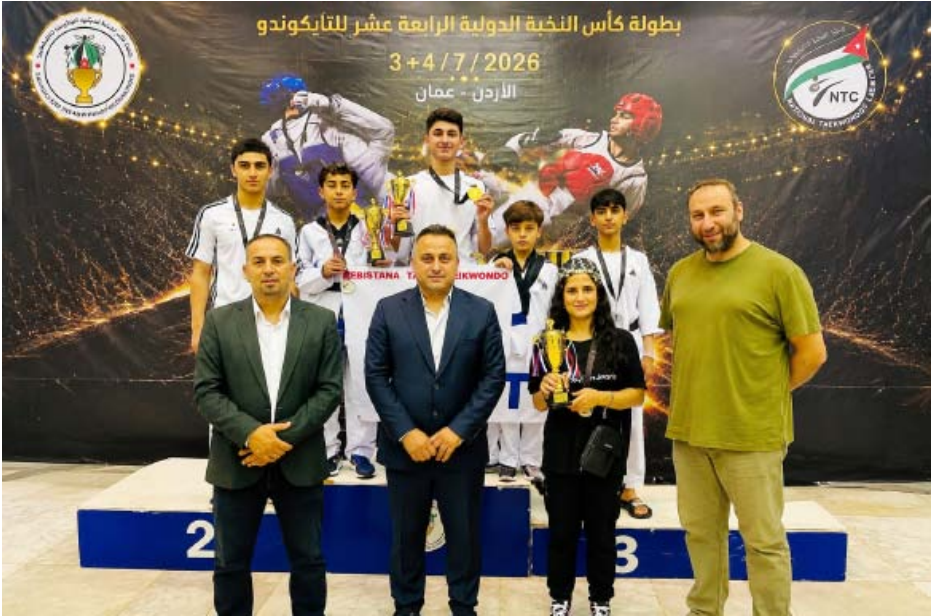
حققت مدرسة نمور التايكواندو

روناهي/ قامشلو - أنهت بعثة مدرسة نمور التايكواندو ببصمةٍ مميزةٍ منافسات بطولة كأس النخبة الدولية الرابعة عشرة، التي أُقيمت في العاصمة الأردنية عقان، بمشاركة 650 لاعباً ولاعبةً يمثلون ثماني دول، من خلال 12 فريقاً دولياً و42 مركزاً أردنياً للتايكوندو.