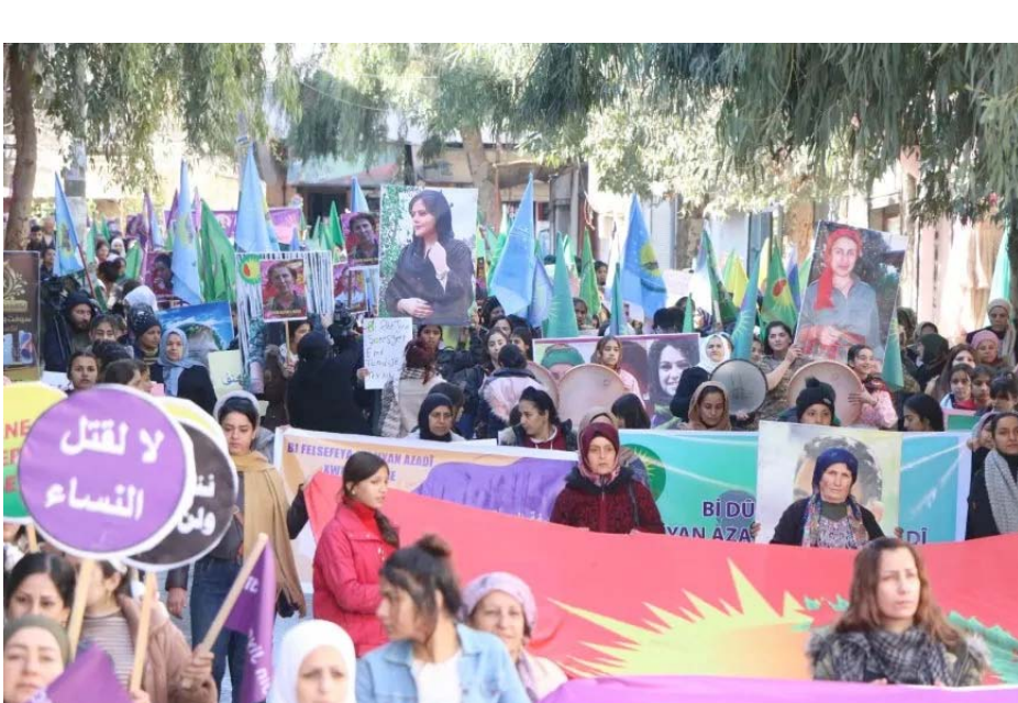
- ثمانية قتلى بينهم طفل وامرأة في مناطق الإزارة الذاتية.