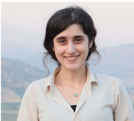
المرأة هي أولى القضايا الاجتماعية الملحة الواجب حلها.