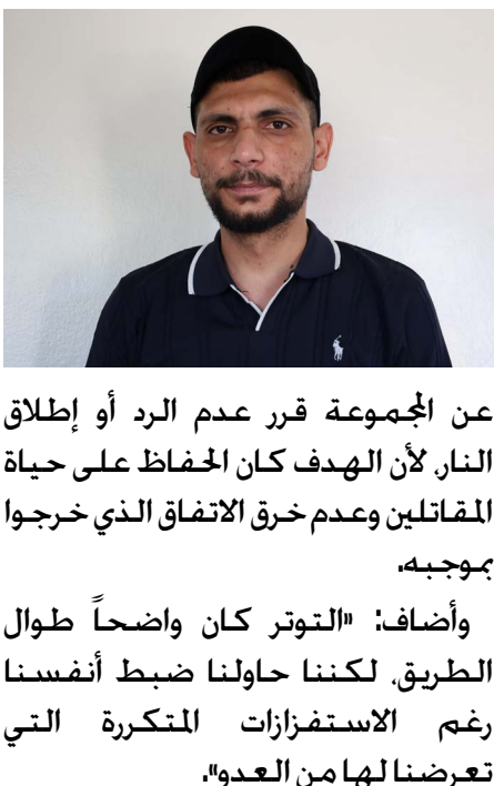
أهور قامشلو، أحد قيادي قوات سوريا الديمقراطية

وإلى جانب التعذيب الجسدي. خدّت «أهور قامشلو». عما يصفه بالحرب النفسية التي كانت تُمارس داخل السجن بشكل مستمر حيث كان يتعمد تعذيب ومجازر ومعاناة لن نستسلم ولن ننفذ معنوياتنا. وسنبقى متمسكين بحقوقنا وكرامتنا حتى آخرهرقٍ».