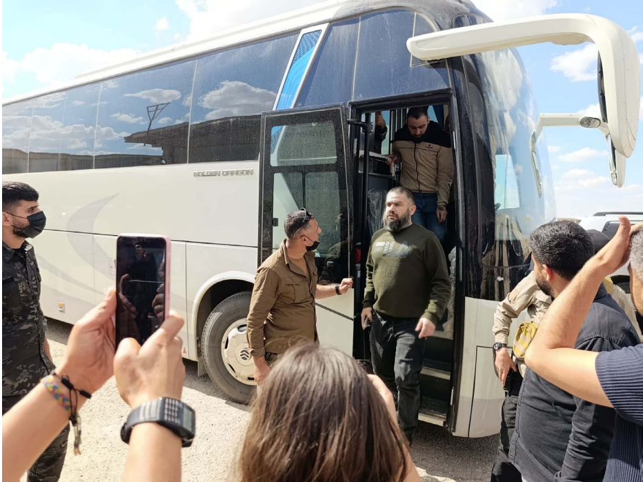
أهور قامشلو، أحد قيادي قوات سوريا الديمقراطية

وأشار إلى أنه كان آخر من غادر ديرحافر. برفقة مجموعة صغيرة تقارب ٢٠ شخصاً. وعند وصوله اكتشف أن من