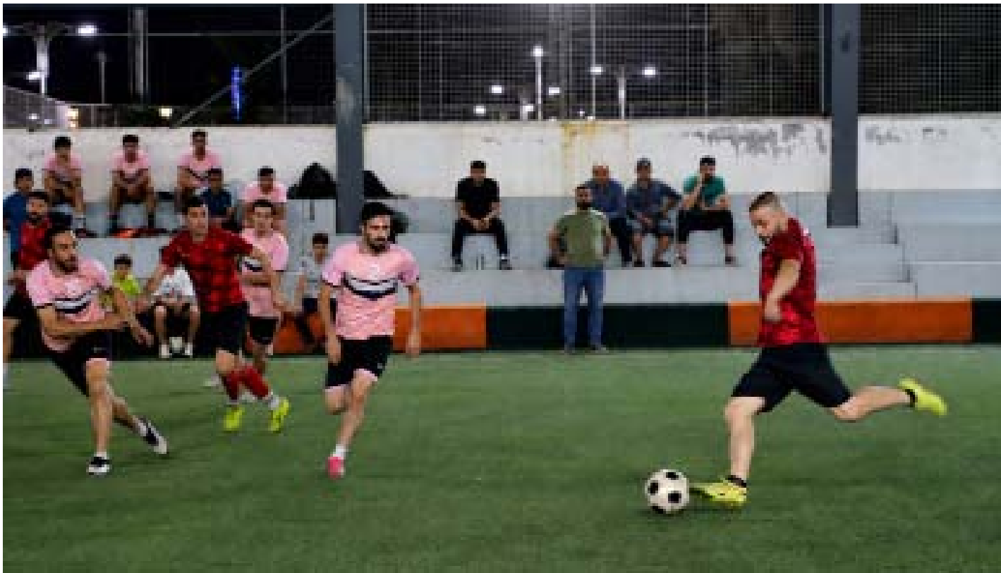
لاعبو فريق قامشلو يلعبون في دوري كرة القدم

روناهي، قامشلو ـ انطلقت منافسات دورة المحبة الكروية على أرضية ملعب آزادي المغطى، الواقع جنوب يوسف كلو بمدينة قامشلو، بمشاركة 24 فريقاً يمثلون مختلف المناطق والأحياء، وما يميز الدورة مشاركة نخبة من نجوم الكرة السورية.