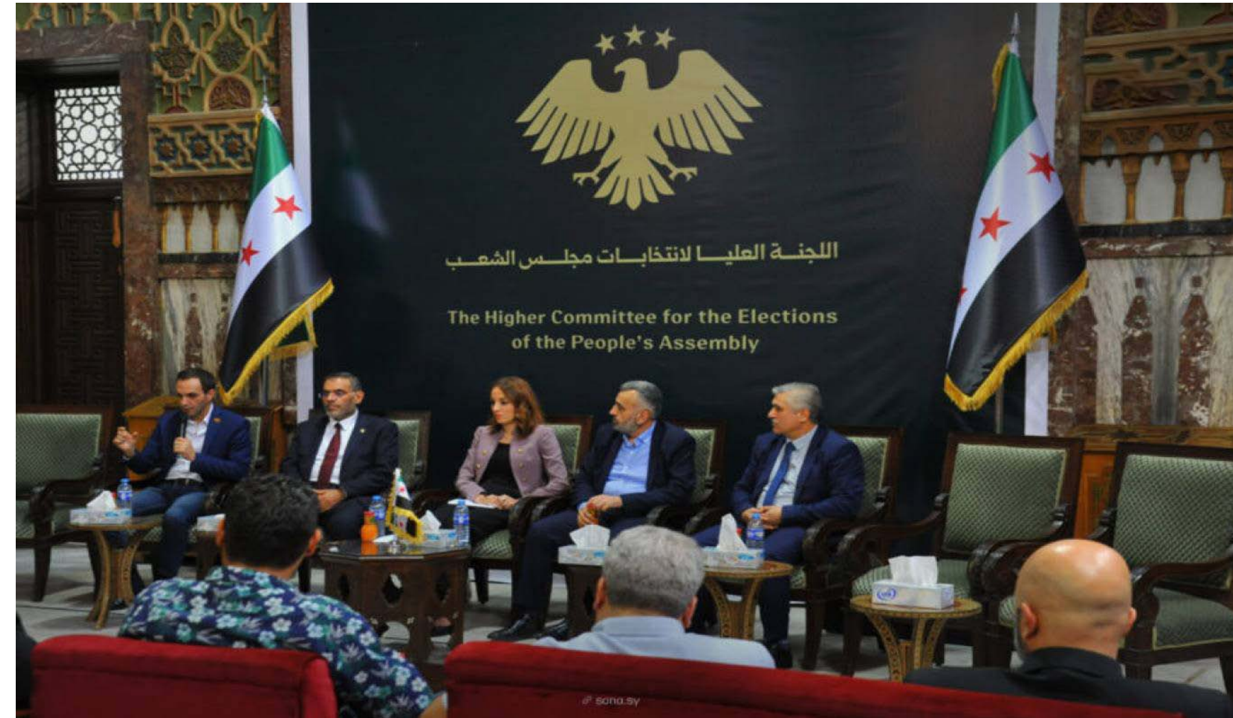
اللجنة العليا للانتخابات مجلس الشعب

قيّم سياسيون سياسة الحكومة السورية المؤقتة المعتمدة على المركزية والسلطة الأحادية وعدوها مجحفة بحق الشعب الكردي ولا سيما فيما يتعلق بانتخابات مجلس الشعب السوري ونسبة المقاعد الضئيلة للکرد في المجلس، وأشاروا إلى أن هذه الانتخابات بعيدة عن النزاهة والديمقراطية ومقاعد الكرد لا تتناسب مع تضحياتهم ونضالهم خلال الأعوام المنصرمة من الأزمة السورية، وشددوا على ضرورة قيام الحكومة المؤقتة بإعادة النظر في السياسات والقرارات المركزية التي تصدر عنها وخاصة فيما يخص انتخابات مجلس الشعب، مؤكداً أن الشراكة الحقيقية لبناء سوريا الجديدة تتطلب مشاركة السوريين كافة فيها.. ص - ٥