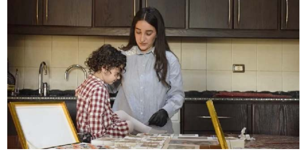
مشروع منزلي صغير

عندما لاحظت انتشار الأعمال المنزلية بين الشباب، «الحرز والحلويات والمأكولات» لكنها لم تجد من يعمل في صناعة الشوكولاتة بأشكال مميزة. وعرضت فكرتها على عائلتها، فكان التشجيع حاضراً، لكن التحدي الأول ظهر سريعاً، إذ لم تجد في الأسواق المحلية المواد اللازمة، لا الفولب ولا أنواع الشوكولاته المناسبة، ومع ذلك بدأت بما هو متوفر واستيراد ما يلزم من خارج البلاد، وأعدت أولى منتجاتها