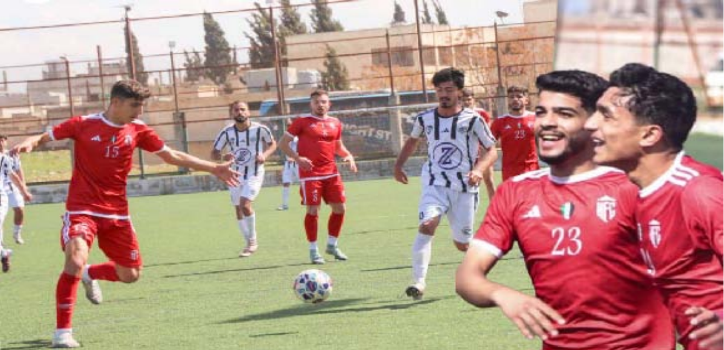
لاعبي فريق شباب الجهاد يلعبون في الدوري السوري الممتاز للشباب لكرة القدم

روناهي/ قامشلو ـ تلقى شباب نادي الجهاد خسارة جديدة في الدوري السوري الممتاز للشباب لكرة القدم للموسم 2025 - 2026، بعدما خسروا أمام شباب نادي حمص الفداء بنتيجة هدفين مقابل هدف واحد، في اللقاء الذي أقيم ضمن منافسات مرحلة الذهاب على أرضية ملعب كفرعايا في حمص.