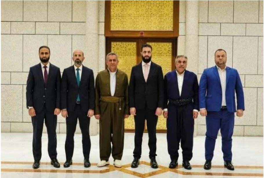
محافظ الحسكة المهندس نور الدين أحمد، ورئيس الحكومة المؤقتة أحمد الشرع، وعدد من المسؤولين الآخرين، في دمشق، حيث تم التباحث حول ملف عودة المهجرين وإطلاق سراح المعتقلين والأسرى.

مركز الأخبار - عقد محافظ الحسكة المهندس نور الدين أحمد، اجتماعاً مع رئيس الحكومة المؤقتة أحمد الشرع، وعددًا من المسؤولين الآخرين، في دمشق، حيث تم التباحث حول ملف عودة المهجرين وإطلاق سراح المعتقلين والأسرى وتطوير البنية التحتية.