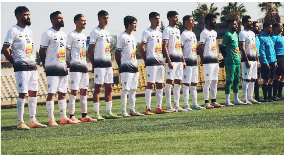
لاعبي نادي الجهاد في مباراة مع فريق من مدينة قامشلو

روناهي/ قامشلو ـ نشرت الصفحة الرسمية لنادي الجهاد الرياضي على الفيسبوك بياناً يناشُد ويُطالب فيه القيادات الرياضية بالعمل على عودة النادي للعب على أرضه وبين جمهوره، وذلك لأن الجهاد مازال ممنوعاً من هذا الحق منذ أكثر من عقدين من الزمن.