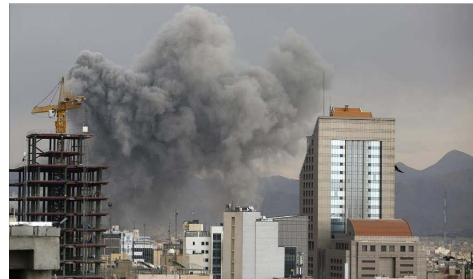
عبد الرحمن الراشد

جَارَ الإشاعات ومنظرو المؤامرات مثل جَارِ الحروب، يفتاتونَ على خوفِ النَّاسِ وهواجسهم، مع أوَّلِ رصاصة في المعركة، انطلقَتْ نظرياتٌ أبرزها أنَّ الحربَ ليست إلاَّ مخططاً استراتيجياً أميركياً ضد الصَّين للسيطرة على بترول الخليج ومراته البحرية، الثَّانية تقول إنَّ ترامب ورَّط المنطقة في حربٍ مدعومة، وسيهرب تاركاً دول الخليج تواجه مصيرها، وهناك من يرى أنَّ نتباهو هو من ورَّط ترامب وسيفرُ الأثنان من المواجهة، والثالثة أنَّ الحربَ سُتت من أجل منح إسرائيل دوراً إقليمياً وتصفية القضية الفلسطينية، كلها يمكنُ أن نتجادل حولها، والحقيقة ليست مؤكدة لكنَّ لماذا لا تكونُ الحقيقة أبسطَ من ذلك؟