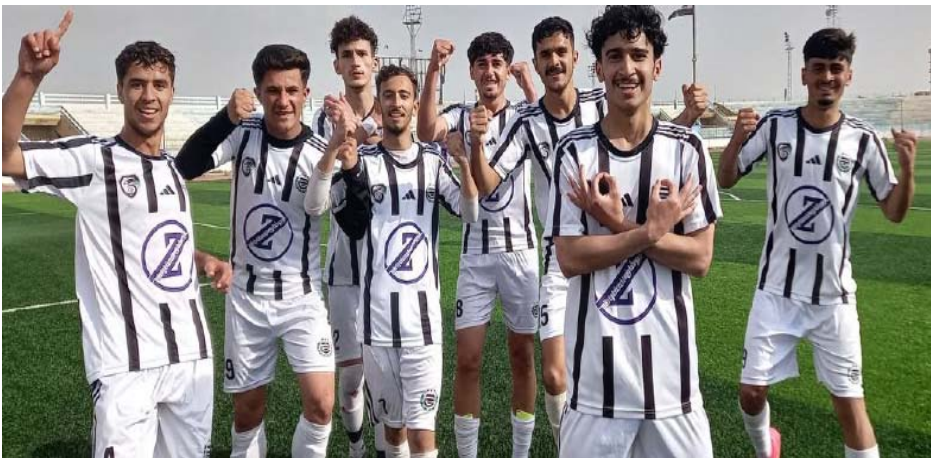
روناهي/ قامشلو - حقق نادي الجهاد نتيجة التعادل مع نادي الكرامة ضمن منافسات مرحلة الذهاب من دوري الشباب الممتاز لكرة القدم للموسم ٢٠٢٥ - ٢٠٢٦، في نتيجة تُعد إيجابية مقارنة باستعدادات الفريقين قبل انطلاق الدوري.

وعادت بعثة الفريق إلى مدينة قامشلو بعد رحلة استمرت أكثر من عشرين ساعات. في معاناة مستمرة منذ سنوات بسبب منع إقامة مباريات