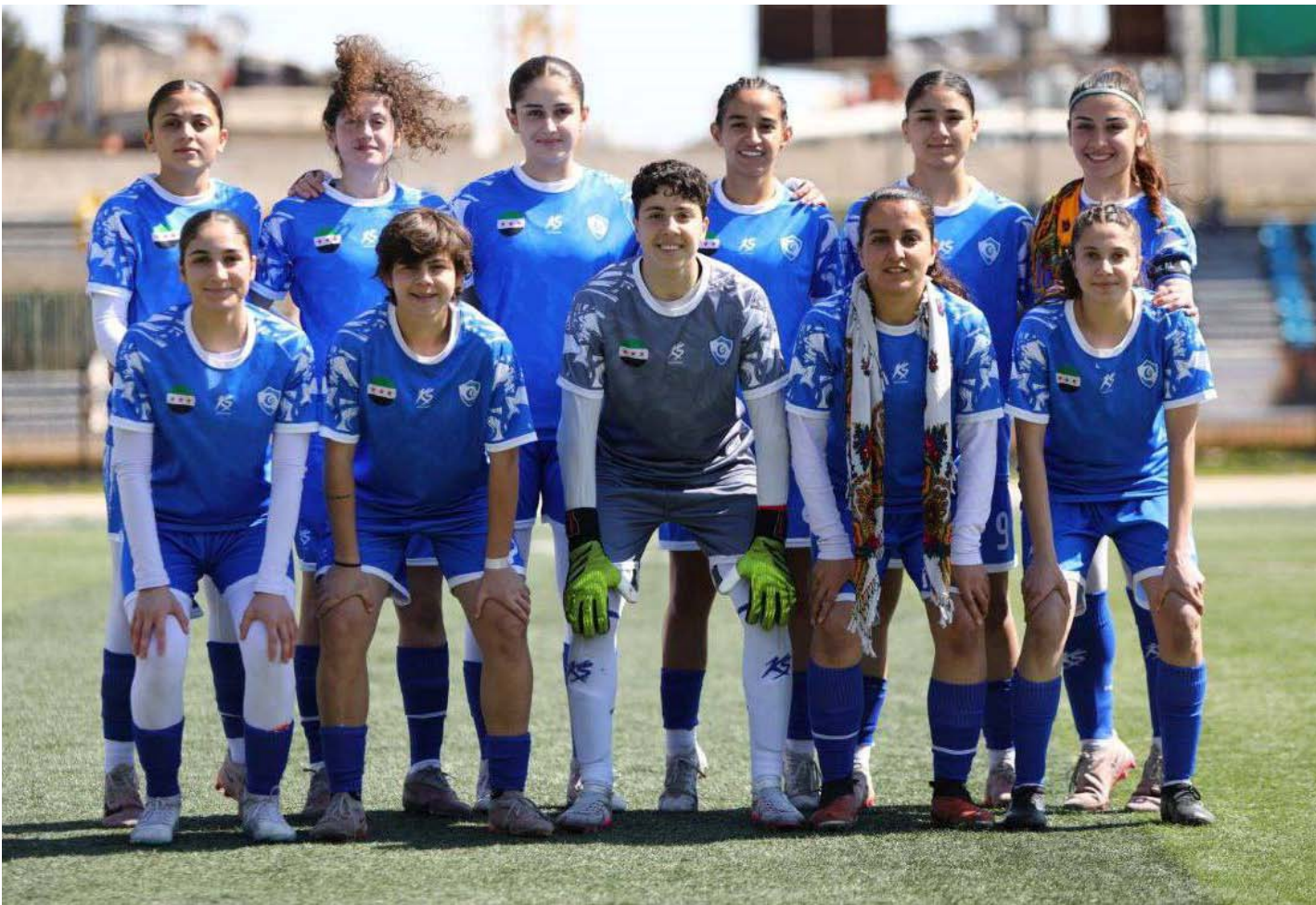
لاعبات نادي الهلال في مباراة مع نادي النصر

روناهي، قامشلو - تستمر سيدات الهلال بأدائهن المميز، حيث قرّنَ على سيدات تلدره بنتيجة كبيرة وذلك ضمن منافسات مرحلة الذهاب من الدوري السوري للسيدات لكرة القدم للموسم 2025 - 2026.