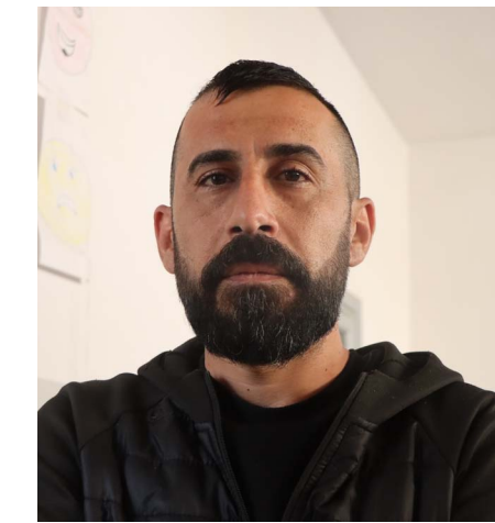
وبعضها صارت كأفراد من عائلته.