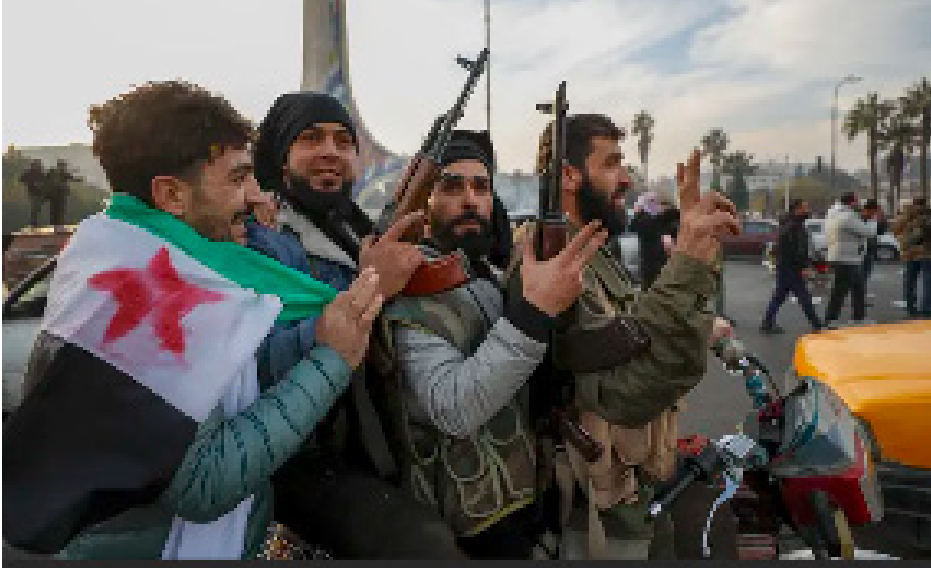
قوات داعش في دير الزور

ومؤخراً بدأت خذيرات غربية تنتمى من احتمال عودة نشاط داعش الإرهابي إذا لم تتخذ القوات الحكومية في دمشق وهل هذا ما بحثوا عنه عندما خرجوا