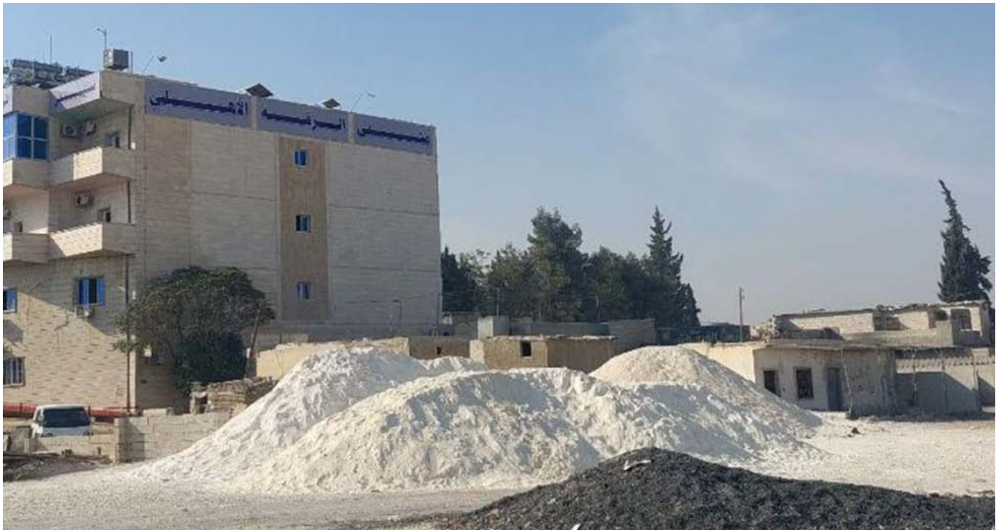
الرقعة المخصصة للبحص

قامشلو، سلافا عثمان - تصاعدت حدة الجدل في الرقة عقب فرض رسوم جديدة على مقالع البحص، ما دفع أصحابها للاعتصام أمام مبنى المحافظة احتجاجاً على قرار يرونه تهديداً مباشراً لاستمرار عملهم، وانعكاساً خطيراً على تكاليف البناء وإعادة الإعمار في مدينة أنهكتها الحرب.