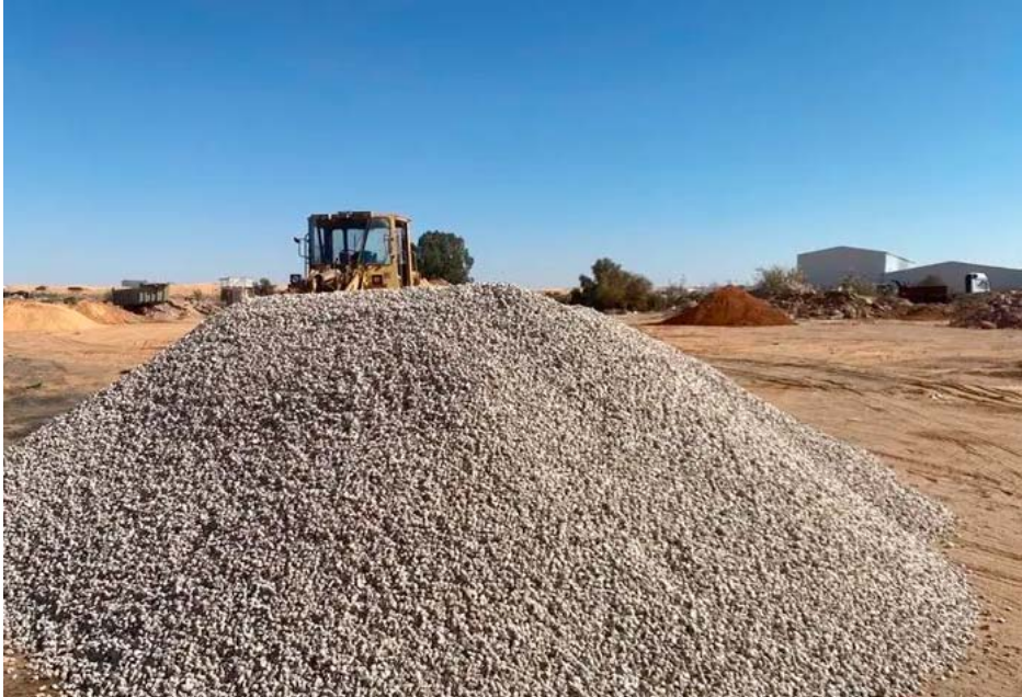
الرقعة المخصصة للبحص

شهد مبنى محافظة الرقة اعتصاماً لعدد من أصحاب مقالع البحص احتجاجاً على فرض رسم جديد قدره دولارين عن كل متر مكعب من البحص المستخرج، المحتجون أكدوا أن القرار يُفرض بعد سيطرة الحكومة السورية المؤقتة على المنطقة، معتبرين أنه يضاعف الأعباء المالية على قطاع عن العمل، أو رفع السعر على التجار والمواطنين لتعويض الفارق».