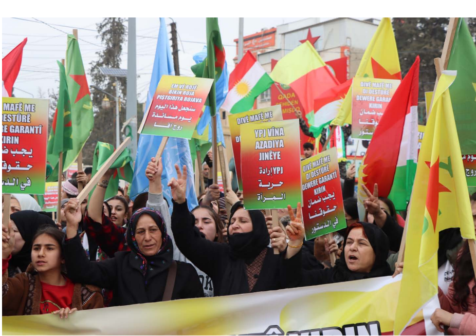
مظاهرة في مدينة حلب

الدراسية، نيرودا كرد - أشار عضو المكتب السياسي في الحزب اليساري الكردي، حسين العلي، إلى أن سبب تفشي خطاب الكراهية والتحريض الطائفي في سوريا، هو غياب الديمقراطية، ولفت، أن البلدان التي يسود فيها القمع والظلم، عادة ما تنتشر فيها الأزمات الاجتماعية، والسياسية، وغيرها.