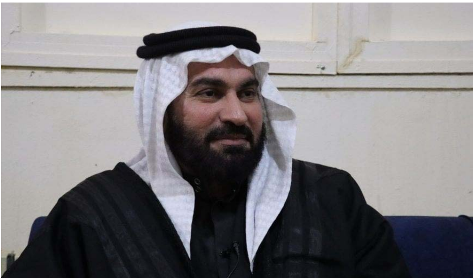
حدوث خلل مؤقت وشرح محدود. لدى بعض الشخصيات أو الأقسام من بعض القبائل والعشائر العربية. وهذا لا يعكس الموقف العام للمجتمع والقبائل والعشائر.