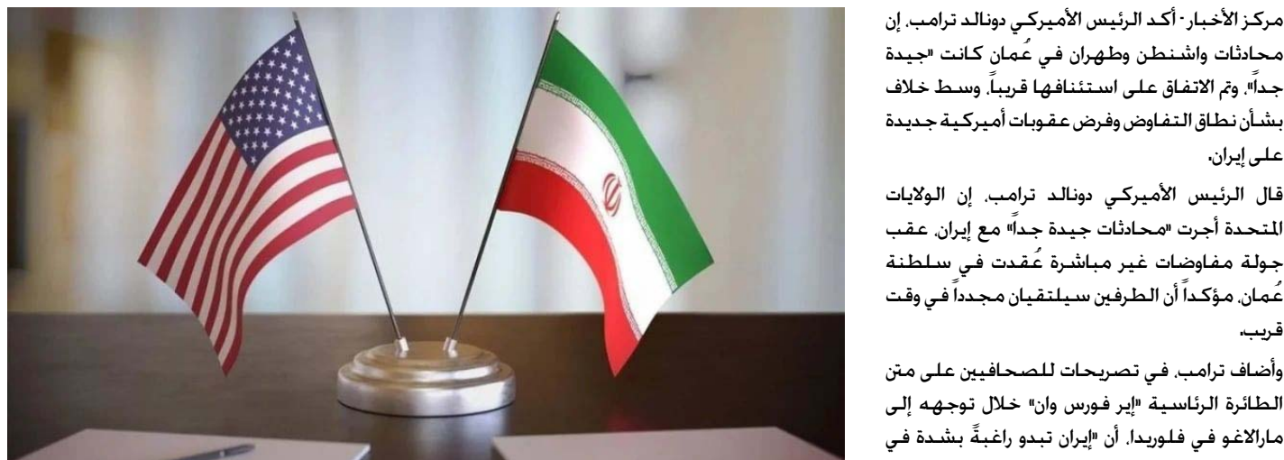
مركز الأخبار- أكد الرئيس الأمريكي دونالد ترامب، إن المحادثات واشنطن وطهران في عمان كانت جيدة جداً، وتم الاتفاق على استئنافها قريباً وسط خلاف بشأن نطاق التفاوض وفرض عقوبات أميركية جديدة على إيران.

قال الرئيس الأميركي دونالد ترامب، إن الولايات المتحدة أجرت محادثات جيدة جداً مع إيران عقب جولة مفاوضات غير مباشرة عُقدت في سلطنة عُمان مؤكداً أن الطرفين سيلتقيان مجدداً في وقت قريب.