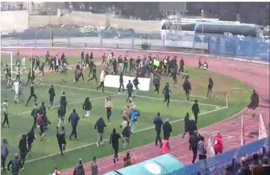
الرئيس السوري الخلووع بشار الأسد.

وفي مباراة أخرى من الدوري السوري الممتاز وحساب الجولة السابعة أيضا تبادلت جماهير نادي تشرين والطلليعة السب والسنتانم، في مشهد يبدو سيصبح اعتيادا في الدوري السوري الممتاز.