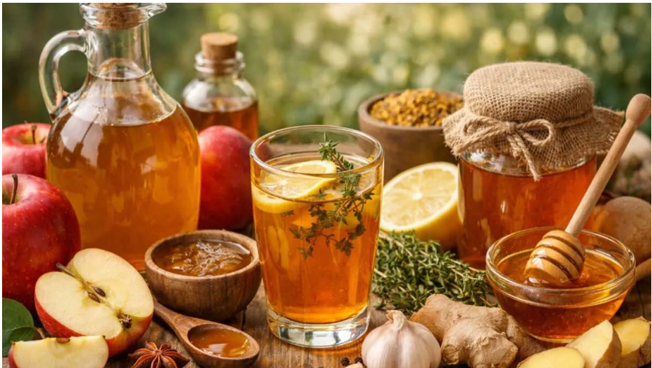
خل التفاح والعسل، من المكونات التي لا غنى عنها في المطبخ.

اضطرابات هضمية أو حرقة معدة بسبب حموضة خل التفاح.