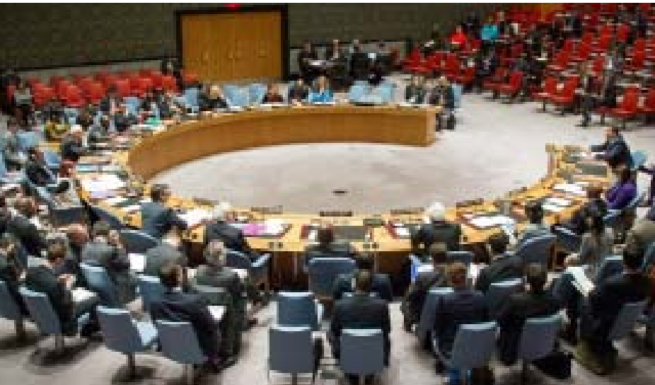
اجتماع في السويداء

«من أمن العقاب أساء الأدب» هكذا يقول للمثل الشهير وما اليوم أمنت هذه المجموعات العقاب الدولي لذا