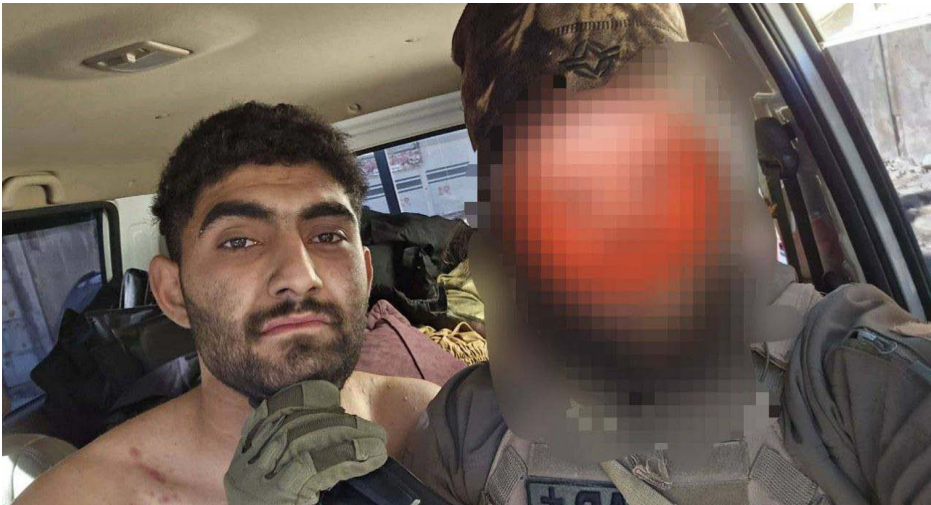
وأشارت إلى أن:«الهجمات ليست مجرد تصعيد عسكري، بل رسالة سياسية واضحة، أي جربة بديراطية محلية ستواجه بالقوة والتنمير، مشددةً على تراجع وسنظل موحدين في مواجهة الإرهاب حتى تحقيق العدالة ووقف هذه الجازر»