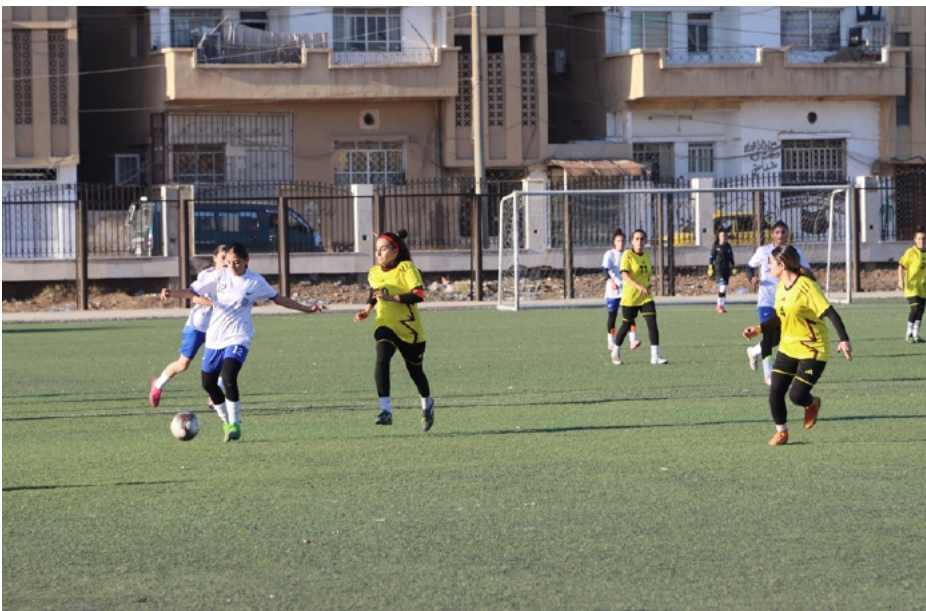
البطولة الثالثة فقد كانت للشابات وأقيمت بمناسبة اليوم العالمي لهاضمة والعنف ضد المرأة، وحقق فريق شبابيات سوريا اللقب.