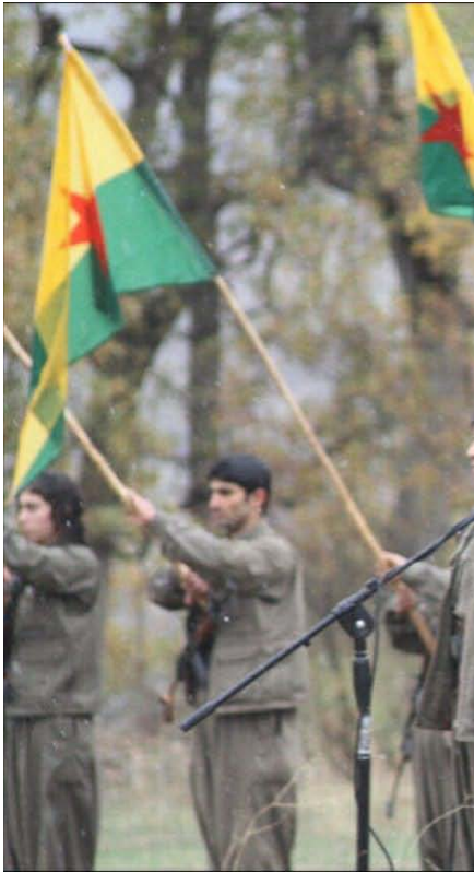
بعد الهزيمة الغير عادلة، والحكم المؤبد ونقل القائد

يعترف الخصوم قبل المؤيدين أن الكريلا ساهمت في رفع مستوى الوعي العام بالقضية. وأجبرت الدولة التركية والعالم على التعامل مع الكرد كقوة سياسية لا يمكن تجاهلها.