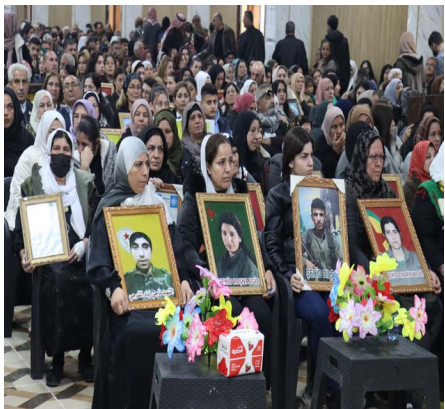
افتتاح صالة لتأدية واجب العزاء لذوي الشهداء في قامشلو