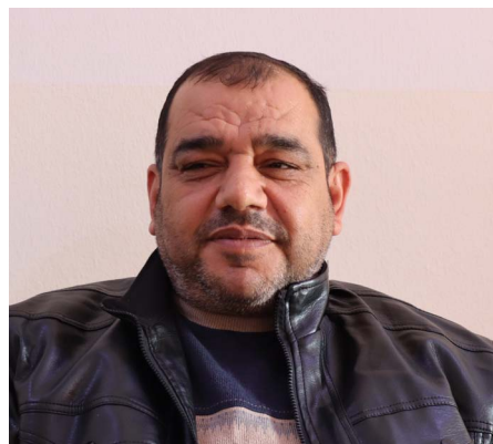
توسعة عاجلة للمشفى الوطني

«تعمل على تعزيز الأقسام بالكادر الطبي والعدات الأساسية لضمان تقديم الرعاية الصحية دون انقطاع. والخدمات وتوفير الرعاية الطبية للجميع استحقاق حيوي لحماية حياة الأهالي وضمان أمنهم الصحي، وسنستمر في تطوير المشفى بما