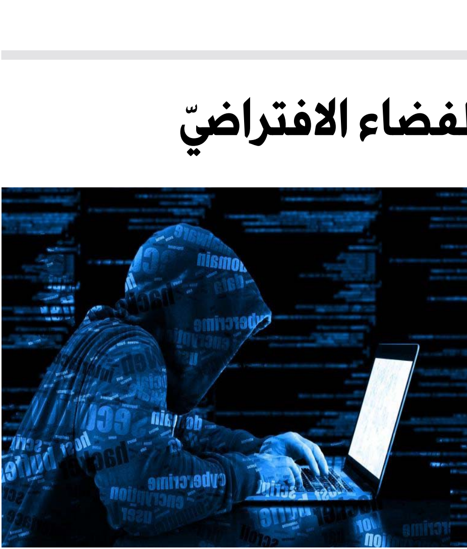
شخص يرتدي ملابس هكس، وهو يرتدي ملابس سوداء مع شريط أحمر على رأسه، وهو يرتدي قناعاً يغطي وجهه بالكامل، وهو يرتدي قناعاً يغطي وجهه بالكامل، وهو يرتدي قناعاً يغطي وجهه بالكامل.

والذباب الإلكترونيّ ليس ظاهرة عشوائيّة بل جزءٌ من استراتيجياتٍ مدرّسةٍ ومعدّةٍ وفق خططٍ مبرمجةٍ، وقد نفّذ الحكومات مبالغٍ طائلةً لإنشاء شبكاتٍ كبيرةٍ من الحسابات الإلكترونيّ تقوم بكتابة التعليمات والإيجابات وإعادة التلقائيّة للخرردات تتضمن معلوماتٍ مضللة وإنشاء المكثف للوسوم (هاشتاغات/Hashtags)، والإيجاب بتفاعل جماهيريّ كبيرٍ والقول الواسع لفكرةٍ معينة، والهدف النهائيّ والتأثير على الرأي العام بالترويج لفكرةٍ معينةٍ أو استهداف فكرةٍ مخالفةٍ أو تشويه صورةٍ حربٍ أو توجّهٍ سياسيٍّ معين، ويسمى كثافة النشر الكبيرة بصيغ الوصول إلى الحقيفة.