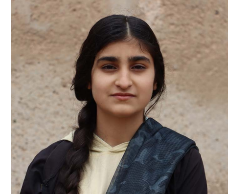
شابات الطبقة يقدّن المبادرات

الطبقة، عيد المجيد بدر . أطلقت الحركات الشبابية في مدينة الطبقة، بالتعاون مع أهالي حي عايد - إذاعة، حملة نظافة واسعة، كل يوم سبت في خطة تهدف لتوسيع المبادرة لتشمل أحياء أخرى، لتعزيز العمل التطوعي وحماية البيئة.