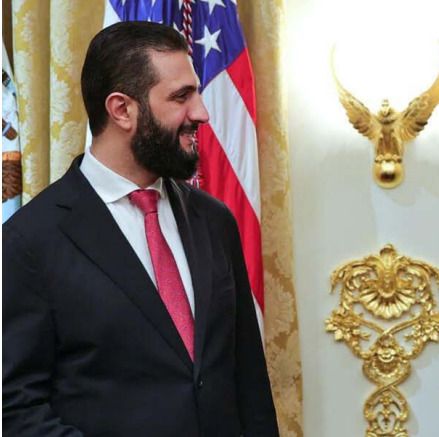
د.علي أبو الخير

تأتي زيارة رئيس الحكومة الانتقالية أحمد الشرع للولايات المتحدة الأمريكية ومقابلة الرئيس دونالد ترامب توقيتًا استراتيجيًا مع دول الغرب بصورة عامة، خاصة بعد لقاء الشرع مع ترامب في الرياض بالعودة في شهر أيار ٢٠٢٥. والتي كانت البداية منذ سقوط نظام بشار الأسد. وتولي أحمد الشرع مقاليد الأمور في سوريا.