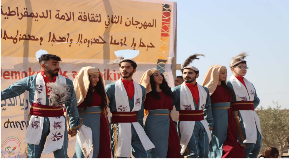
المرأة والتراث العربي روح من الحرية والمساواة

قامشلو، ملاك علي - في مهرجان ثقافة الأمة الديمقراطية، برزت مشاركة المرأة رمزاً للحرية والتمكين، حيث قدمت النساء تراثهن وثقافتهن بكل فخر. من الأطعمة التقليدية إلى الأزياء والحرف اليدوية، مؤكّدت أن للمرأة دوراً محورياً في نقل التراث وإثراء الثقافة الجماعية للأمة الديمقراطية.