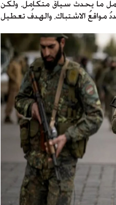
جنود الجيش السوريّ في ريف الرقة