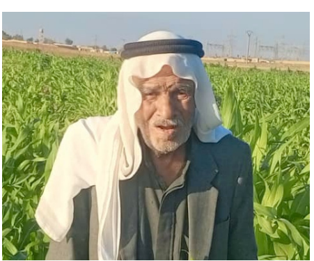
روناهي/ تل حميس - الذرة محصول زراعي متعدد الاستخدامات. يعتبر مصدراً هاماً لعلف الحجوات. كما يلعب دوراً أساسياً في دعم الاقتصاد المحلي استخداماتها تشمل التغذية البشرية والحجوية. ما يجعلها عنصراً حيوياً في حياتنا اليومية.

كما أفادنا: «تعتبر من المحاصيل التي تُزرع في ظروف مناخية متنوعة. وختاج إلى كميات معتدلة من المياه. ما يجعلها خياراً جيداً للمزارعين. ومع الممارسات الزراعية الجيدة. كبيرين. تقوم بزراعتها في أواخر الصيف وتعتمد على تقنيات زراعية حديثة لضمان نموها بشكل صحي. وعندما يحين وقت