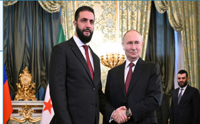
عدسة دعاء يوسف / مخيم وانشو كاني/

منذ أن بدأ سلاح الجو الروسي توجيه ضرباته الجوية في الأراضي السورية بتاريخ ٣٠ أيلول ٢٠١٥. دخلت موسكو رسمياً مسرح الحرب السورية لاعباً مركزيًا لا مجرد حليف سياسي لنظام بشار الأسد. تلك الضربات التي سُميت حينها «ضد الإرهاب». كانت نقطة التحول التي كرست الدور الروسي كقوة احتلال ناعمة تمسك بخيوط القرار العسكري والاقتصادي في دمشق. ص-٨