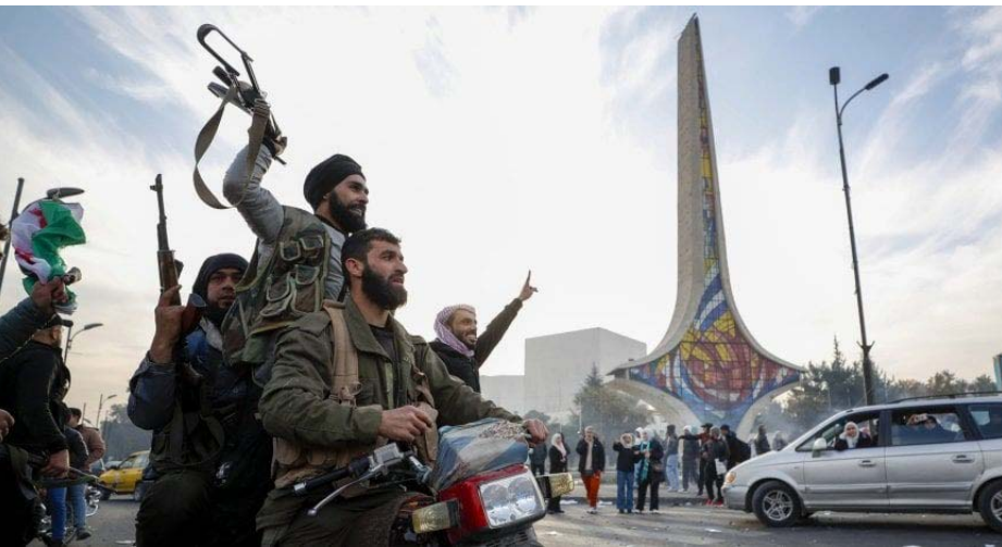
مركز الأخبار - قتل ١٠,٩٥٥ شخصاً بينهم ٣٠٥٤ أعمدوا ميدانياً منذ الثامن من كانون الأول الفضوى الأمنية والعدام محاسبة الجناة.

وأوضح. إن هذه الأرقام تعكس استمرار دوامة العنف والإفلات من العقاب. مؤكداً الحاجة الملحة لآليات فعالة للمساءلة وحماية المدنيين.