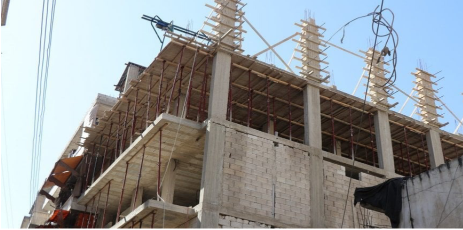
البطالة في حال استمرار الحصار.

مركز الأخبار - تواصل الحكومة الانتقالية فرض الحصار على حيي الشيخ مقصود والأشرفية في حلب، عبر منع إدخال مواد البناء والمحروقات، ما يهدد بشّل مشاريع الإعمار ويفاقم معدلات البطالة في المنطقة.