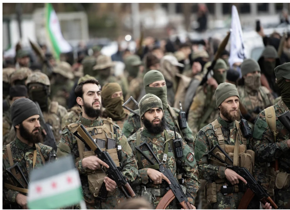
مقاتلون من الجبهة الشماليّة في سوريا

لا معطيات ومؤشرات تفيد بأنّ الحكومة الانتقالية بصدد فتح معركة موسعة ضد المسلحين الأجانب. بل محاولة لإخضاعهم كغيرهم من السوريين تمهيدا لنسحب سلاحهم وتسوية أوضاعهم حتى لا تبقى مواقعهم بؤراً أمنية متقلّبة، ولكن ثقة مخالفون من عم جأوب للمسلحين الأجانب مع سياسة الحكومة الانتقالية جهة تسليم سلاحهم وموجهم بالشعب السوريّ، ويحمل قسم منهم أفكارا إيديولوجيّة متطرفة ويرفض سياسة الانفتاح والبرغمانيّة التي تبديها الحكومة، وتمّ تداول