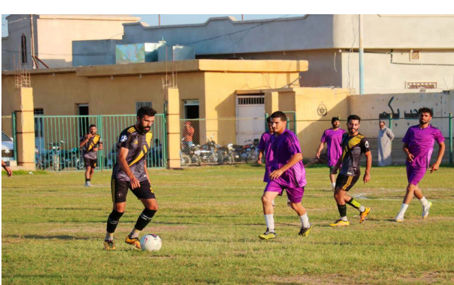
لاعبي نادي الشمال يلعبون في دوري الدرجة الأولى للرجال لكرة القدم في إقليم شمال وشرق سوريا.