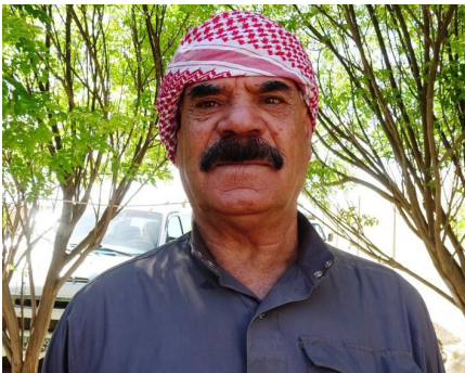
موسم ضعيف وإنتاج متراجع

٣، تنشيط الوحدات الإرشادية الزراعية في مختلف المناطق، بما يتيح للفلاحين الحصول على الاستشارات اللازمة