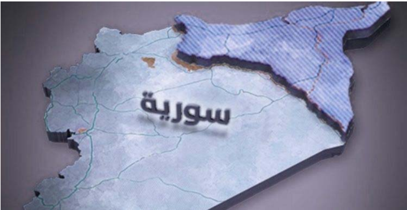
مركزروج آفا للدراسات الاستراتيجية

منذ اندلاع الأزمة السوريّة وما تبعها من خوّلات إقليمية معقدة. منذ اليوم الأوّل انخرطت تركيا في الأزمة السوريّة وفي قلب معادلة شديدة الحساسية جُمع بين هواجسها الأمنية العميقة ومخططاتها. فلساليّة الكرديّة لم تعد شيئاً داخليا محصوراً بحدودها الوطنيّة. بل خوّلت إلى ملفٍ إقليمي يتجاوز أُنقرة إلى ساحات الصراع في سوريا والعراق.