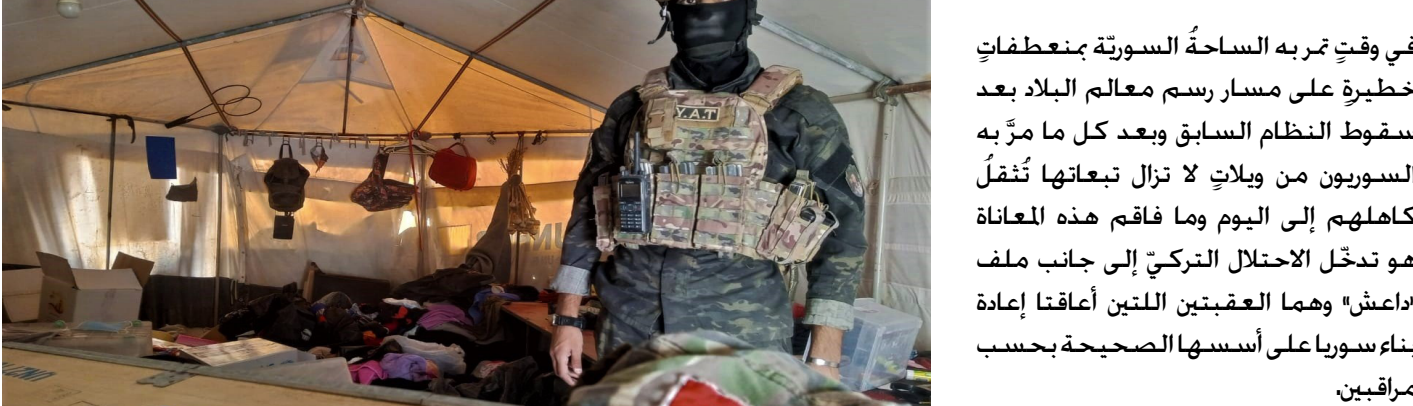
فالتناغم الكبيربين الخطوات التي تخطوها

دولة الاحتلال التركيّ والعمليات الإرهابية التي تنفذها مرتزقة «داعش» بدأ واضحاً وجلياً كونهما يتحركان في خطين متوازيين يلتقيان عند هدف واحد وهو استهداف مناطق شمال وشرق سوريا هذا التزامن لم يعد مجرد صدفة عابرة بل بات يثير تساؤلات عميقة حول طبيعة العلاقة غير العلنة بين الطرفين والتي من شأنها تعقيد المسار الطبيعيّ للمعادلة السوريّة.