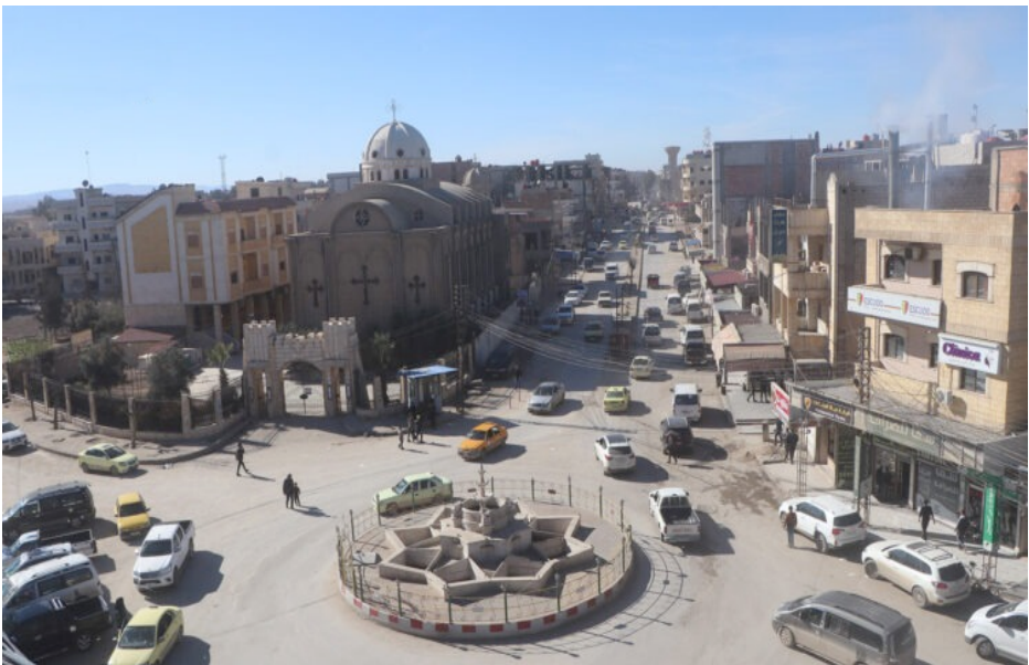
تسول في الحسكة

الوقت، فقد يدفعهم بحثهم عن المال بأسهل الطرق إلى السرقة والنشل وهذا ما بات معروفاً ومشهداً شبه مألوف يومياً في شوارع مدينة الحسكة وريفها، وخصوصاً في الأسواق الشعبية أو الشوارع التي تشهد حركة كثيفة، وإلى جانب تلك المخاطر قد تولد ظاهرة التسول أو البحث عن المال بأسهل الطرق ثقافة الاتكالية، التي قد تفقد دافعها للبحث عن عمل شريف وهذا يفسر وجود الثمات من الأطفال والنساء والشباب والشيوخ في الشوارع، وهم يفترشون الأرض ويستجدون المال من المارة.