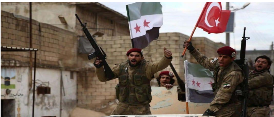
مرتزقة الاحتلال التركي يخطفون ثلاثة شبان من خيمة عزاء في ريف عفرين المحتلة، أثناء مشاركتهم في واجب عزاء ولا يزال مصيرهم مجهولاً.