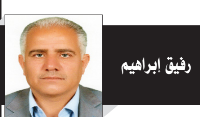
بعد سقوط النظام البعثي في سوريا، في الربع الأخير من العام ٢٠٢٤، واجهت سوريا، تحديات كبيرة، وعلى رأسها الفراغ الأمني، خل هيئة خبير الشام المؤسسات الأمنية التابعة لوزارة الداخلية وغيرها وبشكل عشوائي وغير مدروس، وبالنتيجة كثرت عمليات السطو والقتل، وزادت الجرائم بأشكال متعددة، وحتى معظم الجرائم ارتكبتها عناصر تنتمي لما يسمى الأمن العام، التابع للحكومة الانتقالية، وخاصة عمليات النهب والسرقة للمنازل والأحلات التجارية، وهذا ما ترك غصّة في نفوس السوريين، وأحدث إشارات استفهام كثيرة لدى المجتمع الدولي.

منذ تأسيس «جهاز الأمن»، وحتى اليوم، وهو يعاني من نقص العديدي الذي لا يمكن السيطرة على الأوضاع في العاصمة دمشق فكيف به يقوم بمهامه على مستوى المناطق التي تسيطر عليها الحكومة الانتقالية، وأيضاً قلة الخبرة في الملف الأمني، لأن معظمهم كانوا في صفوف الجموعات المرتزقة، وهم لا يستطيعون العمل كما يجب في التعامل مع الناس وقضاياهم، وحتى طريقة أسلوبهم مثار انتقاد وسخرية من المواطنين.