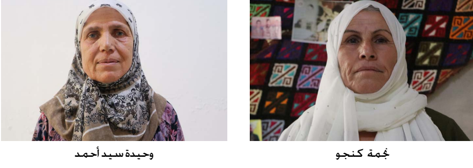
وجيدة سيد احمد

واختتمت: القائد عبد الله أوجلان ورغم إعلانه مبادرة السلام التاريخية وقيامه بخطوات لفتح باب الحوار وإرساء أسس الديمقراطية والعيش المشترك إلا أن الدولة التركية ما تزال متمسكة بخطوة تعكس إرثهتؤ في التمسك بوجوده وقضيتهن الذي ناضلن عنها لعهود. ورفضهن سياسات التهيش والإنكار التي تمارسها الدولة للشروعة.