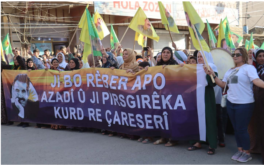
أوجلان مع أعضاء المجلس الوطني في ٢٠٠٤

إن بناء السلام؛ يتطلب شروطاً رئيسية يجب توفيرها لكي يعم السلام. ومن أبرز وأهم هذه الشروط. توفير بيئة آمنة ليتمكن الناس من إدارة شؤونهم بالشكل الذي يرونه مناسباً من خوف. بالإضافة الى ضرورة وجود قواعد أخلاقية وقوانين ناظمة للعلاقة بين الناس والسلطات بحيث يستطيع الشخص متابعة أموره مع مؤسسات الدولة دون وجل أو رهبة، أي بمعنى آخر أن يكون هناك قانون يكون فيه الجميع متساوون أمامه، مؤسسات الدولة دون وجل أو رهبة، كل هذه الأمور وأشباه أخرى مذكورة والإنسانية ولكن للأسف بقيت مجرد حبر على ورق عندما يتعلق الأمر بأمر تُهدد مصالح قوى الهيمنة العالمية التي هيمنت حتى على هذه المنظمات التي من المفترض أن تكون محايدة.