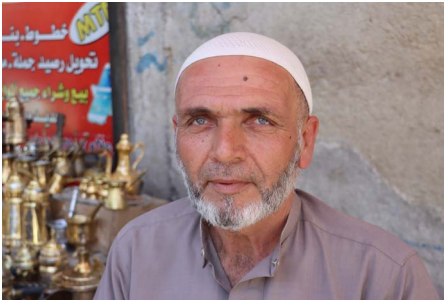
التحديات والعمل اليومي

ويبيع العلي بعض الدلال بين ٢٥٠ ألف و٥ مليون ليرة سورية. لكنه أكد. أن الهدف الأساسي ليس الربح. بل الحفاظ على التراث وإعادة الروح