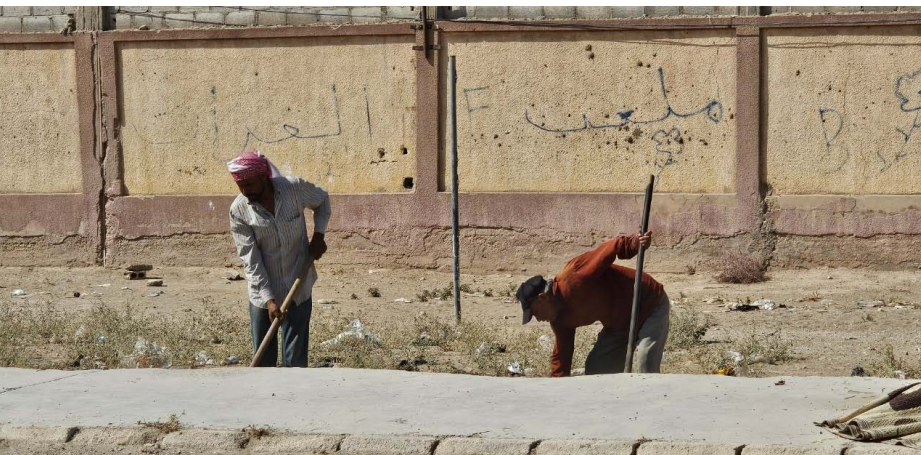
بين أبناء الحي بالعمل الجماعي وروح المنافسة الإيجابية.