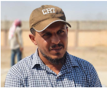
المياه الذي نفذته البلدية مؤخراً، وأشار الدلول: «بناءً على مقترح كوميون الدلول»، أن أعمال التأهيل جاءت بعد تعرض ملعب كرة القدم لأضرار نتيجة مشروع قناة

وتسعى بلدية الشعب من خلال هذا المشروع الزدوج إلى توفير بيئة آمنة ومتكاملة لممارسة أكثر من نوع رياضي بهدف تنمية مهارات الأطفال والشباب وصقل مواهبهم، فإلى جانب إصلاح أرضية ملعب كرة القدم وتجهيزه، بدأت البلدية بتنفيذ ملعب مخصص لكرة الطائرة بما يتيح تنوع الأنشطة الرياضية وتوسيع قاعدة المشاركة بين الأطفال من مختلف الفئات العمرية.