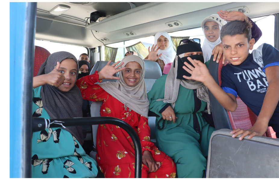
تأسيس مخيم المحمودلي

وحملت أجواء عودة النازحين الكثير من المشاعر للتجاوب، بين دموع الفرح والحنين، حيث اصطحب الأهالي وابتاعت: «نرى في عيون الأطفال فرحة الذين عانوا لسنوات من ظروف النزوح القاسية».