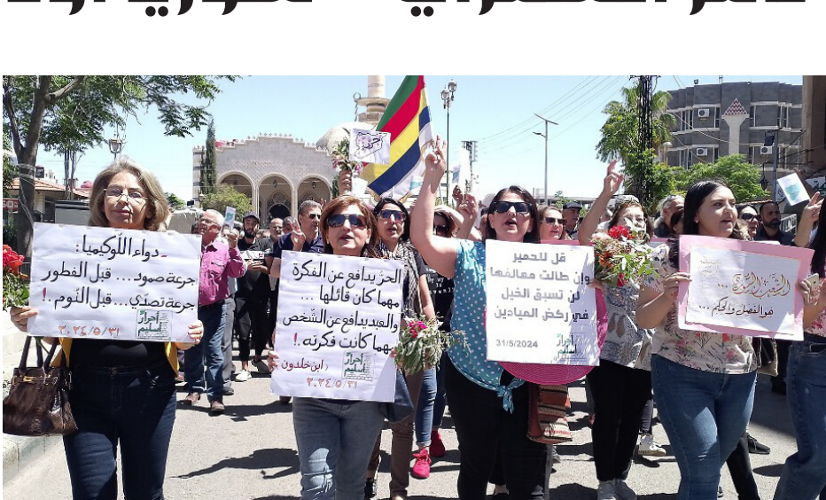
هذه المرحلة الفصلية بأمان.

الأزمة السورية المعقدة سببتها التدخلات الخارجية، ووجهة التدخلات زرعّت بذور الشقاق الطائفي والعرقي، والديني ما جعل الوحدة الوطنية ضرورة وجودية، ففي ظل مناخ سممته خطبات الكراهية، وصغقت فيه الخلافات على حساب مصلحة الوطن والمواطن، يبرز البحث عن أرضية مشتركة، وفهم جامعة، كمشيول جديد لإتفاضة ما يمكن إنقاذه، وإعادة الأساسية للحلول.