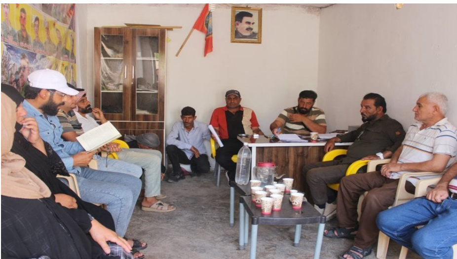
اجتماعات الكوميونات والمجالس في شمال وشرق سوريا.

يوجد في مقاطعة الجزيرة كبرى مقاطعات الإقليم ٢٠١٦ كوميناً، ويجري العمل فيها بموجب هذا القرار منذ ٢٠ يوماً، ومن هذه