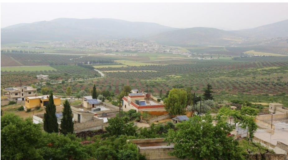
مهجرو عفرين والشهباء يؤكدون على العودة إلى بيوتهم

تعكس شهادات المهجرين شعوراً مشتركاً بالخذلان، مع توثيق حالات نهب