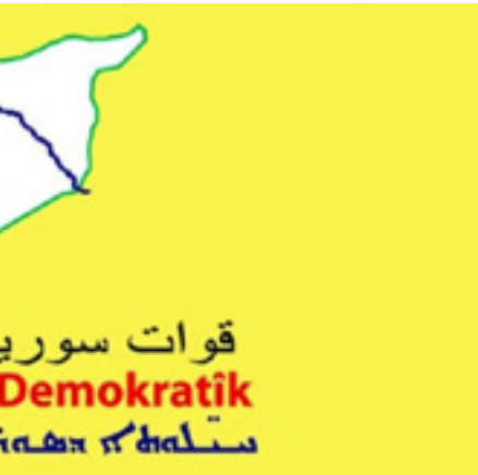
والداعمة لهذا الهجوم المركب.

هذا وتصاعدت الاشتباكات في ريف السويداء مع شن قوات تابعة للحكومة الانتقالية في سوريا