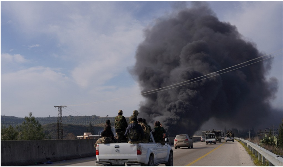
مقاتلون من الجيش السوري الحر يمشون في شوارع مدينة قامشلو.

قامشلو، علي خضير ـ تحدّث أحد النازحين من مدينة حمص في قامشلو، عن الانتهاكات التي حصلت في منطقتهم والمناطق الساحلية، واصفاً بأنها كانت مروعة، مبيناً أنّ أغلب الجرائم ارتُكبت في الريف الغربي لمدينة حمص، كما تطرق إلى الجرائم التي حدثت في جيلة بحق الشعب العلوي، من قتل وخطف وحرق للمنازل، وأن مناطق الإدارة الذاتية أصبحت الملجأ الوحيد الذي يسوده الأمان والعيش المشترك في هذه الظروف.