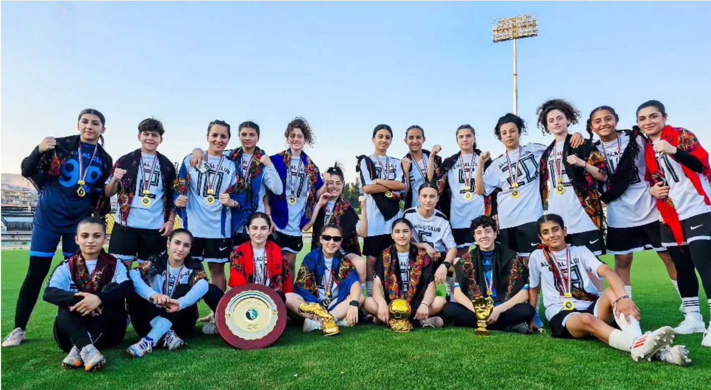
لاعبات نادي «الهلال» في بطولة الدوري السوري لعام ٢٠١٦.

قامشلو، جوان محمد ـ كانت لاعبات أندية السيدات وهن يلعبن كرة القدم أو يخرجن للمران محل تنمر من الكثيرين من الشباب وخاصةً من ينتمون لأندية مقاطعة الجزيرة. ولكن، مع مرور الزمن أصبحوا هؤلاء أنفسهم يمدحون ويتفاخرون بأن تلك الاعبات من مدينتهم، علماً لم يكن الطريق للألقاب مفروضاً بالورود لهن، بل كان مترامناً بالتمرر والبخرية والريصاص والدم.