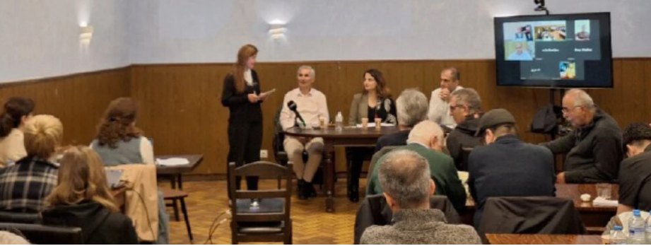
طومسون رونجهونان فير له فيرقة

مركز الأخبار-تزامناً مع الذكرى السنوية الـ١٢٧ ليوم الصحافة الكردية، قرر العاملون في مجال الصحافة الكردية في أوروبا تأسيس جمعية باسم «تجمع صحفيي كردستان في أوروبا» وشهدوا على ضرورة التقدم بالمجال الإعلامي تزامناً مع التطورات،