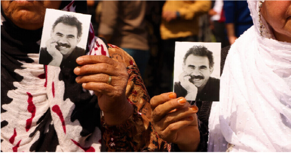
دجوار أحمد آغا

دعا القائد عبد الله أوجلان منذ بداية تأسيس حزب العمال الكردستاني إلى السلام، وذلك من خلال مبادرات عدة، طرحها على دولة الاحتلال التركي، إلا إن الطرف الأخير لم يستجب لها، وزيادة التعنيف بحق الشعب الكردي زاد من تعميق الأزمات.