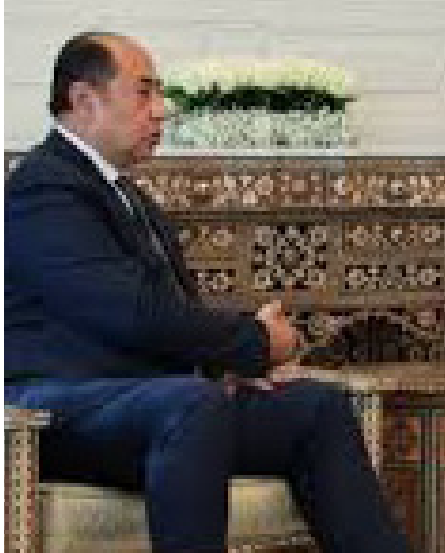
وزير الخارجية السوري بشار الأسد يجتمع مع وزير الخارجية العراقي فهد المكي في بغداد

خلال زيارة الوفد الأمني العراقي إلى سوريا دعم رما أن مخاوفها متزايدة ومباشرة. نتيجة وجود بيئة اجتماعية جاهزة في الأردن بإمكان أي قوة خارجية خربكها ضد حكم الملك عبد الله. وسبق أن حررت الأردن من وجود مخططات إيرانية لدعم الفلسطينيين والإخوان المسلمين هناك. الإيراني في بغداد الأسبوع الماضي. أيدي