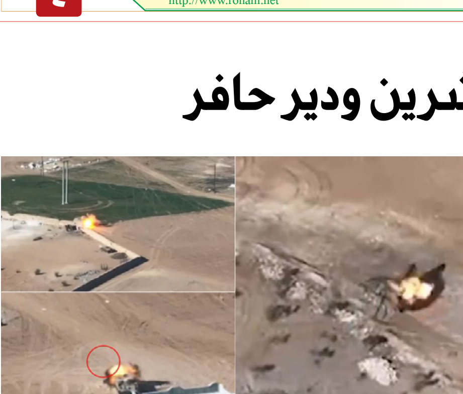
دويشكا، ولم تسفر عن أي أضرار تذكر.

وأكد البيان «وحماية السد قمنا نحن كشعب شمال وشرق سوريا، بإرسال قوافل