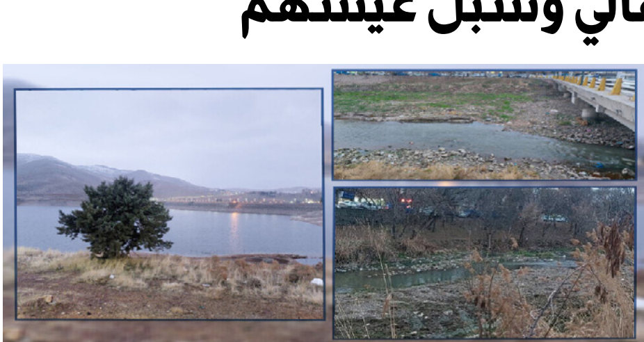
شهدت مقاطعة دير الزور خلال عام ٢٠٢٤ إنجاز وتشغيل عدد من محطات المياه الحيوية. مُعلنةً عن ختسن ملحوظ في توفير المياه الصالحة للشرب لسكان المقاطعة. وتعدّ هذه المشاريع جزءاً من جهود كبيرة لإعادة تأهيل البنية التحتية المائية المتضررة.

المزارعين. وكما أن الآبار أصبحت أعمق ومياهها أصبحت نادرة. فإن البعض يفكر في تغيير زراعة المحاصيل في السنوات القادمة. ولكن من المستحيل الهروب من عواقب هذا الضرر.