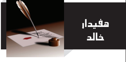
يوماً بعد آخر، تتكشف أهداف سوريا، وأطماع مخلوف كبيرة من نوابها بالمنطقة، وذلك من خلال تدخلها المباشر في الشأن السوري. مُستغلة علاقاتها الوثيقة مع هيئة خير الشام والفصائل الإرهابية، التي أطلحت بالنظام السوري السابق وعلى رأسه هيئة أحمد الشرع للتحقيق بـ «أبو محمد الجولاني». فالواضح أنَّ مصالح تركيا الذاتية تطفئ على مصلحة بناء الاستقرار في سوريا.

بعد ساعات قليلة من سقوط النظام السوري مطلع الشهر الجاري، سارع رئيس النظام التركي رجب طيب أردوغان إلى الكشف عن أطماعه التوسعية، وما يريده من سوريا الجديدة، فأرسل وفوداً عديدة للقاء بالإدارة الجديدة بدمشق والتدخل بشكل مباشر في شؤونها الداخلية، الفصيح يعلم أن للدولة التركية تاريخاً مليئاً بالتدخلات في الدول المجاورة وحُوث تدخلاتها تلك كما نرى إلى احتلال دائم وسيطرة أجنبية.