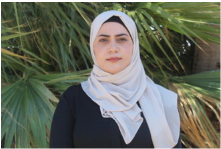
القائد عبد الله أوجلان رمز السلام

روناهي، الطبقة ـ في الذكرى الثالثة والأربعين ليوم السلام العالمي، أكدت النساء في تجمع نساء زنوبيا في مقاطعة الطبقة، أنهمّنّ "لا يستطعنّ تحقيق مجتمع يسوده السلام دون تحرير القائد عبد الله أوجلان جسدياً".