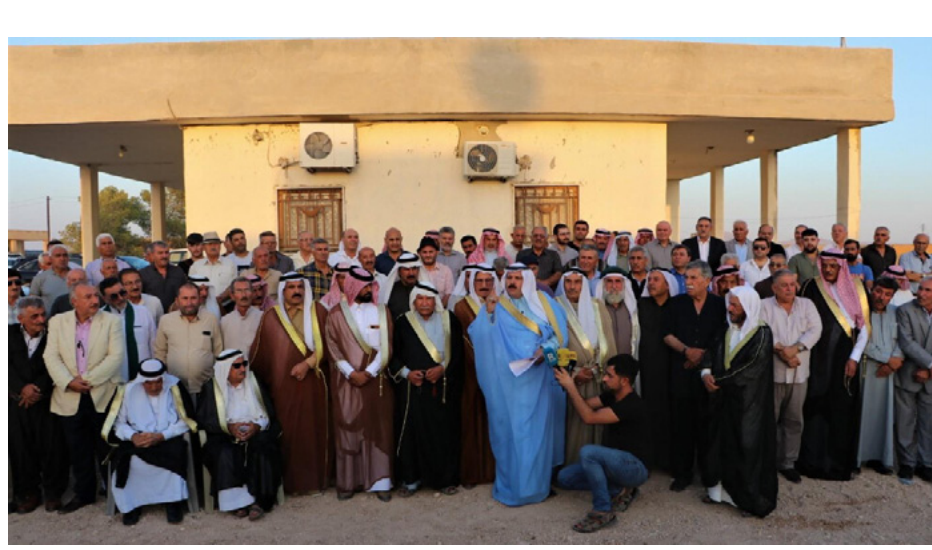
بالنسجيج المجتمعي للمنطقة،

دير الزور بوصلة الأطماع الإقليمية، التي تفرسها لعنة الجغرافية الهامة، فهي عقدة وصل وحلقة ربط هامة في المنطقة، التي تتمتع بطبيعة عشائرية وقبلية حاول الأطراف الخارجية استغلالها. لإحداث فتنة داخلية، بهدف زعزعة أمن واستقرار إقليم شمال وشرق وسوريا، والإدارة الذاتية الديمقراطية، لكن الترابط المجتمعي بين القبائل والعشائر والشعوب، أفضل هذا الخطة، من خلال الائتاف الشعبي حول قوات سوريا الديمقراطية، التي حررت المنطقة من مرتزقة داعش، وحافظت طيلة السنوات النصرمة على أمن واستقرار المنطقة، وقد دافعت تلك القوات عنها، وفق أسس الحق المشروع في الدفاع عن النفس، وهذا ما أفضل الخططات، التي حيكت من المجموعات المسلحة التابعة لحكومة دمشق. في محاولة لإضفاء الطابع العشائري على مشاريعها المشبوهة في دير الزور، تلبية لأجندةٍ خارجية خاطو للعبث الانتقامية الأمريكية.