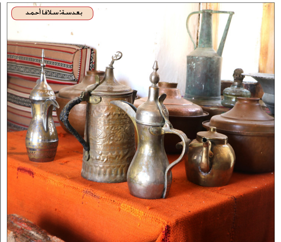
بعديسة، سلفاً أحمد

ونشأت مريم بربري في قرية بحينة صفانس وسط