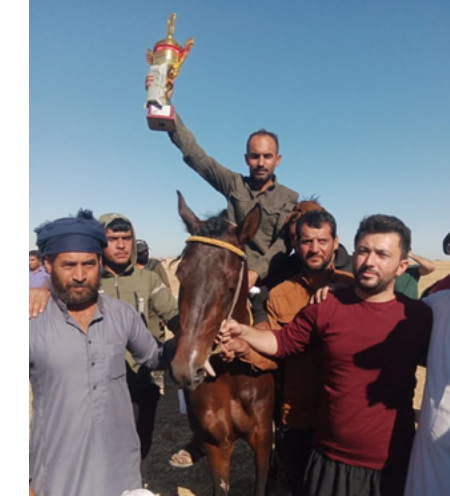
خيول تشارك لأول مرة، وتضمنت البطولة عشرة أشواط. الشواط

تقوم جمعية الخيول العربية الأصيلة في مقاطعة الجزيرة بالتعاون مع مربي الخيول والاتحاد الرياضي في مقاطعة الجزيرة في كل فترة القيام بسباقات للخيول في المنطقة. فيقوم أكثر من سباقين في السنة للخيول العربية الأصيلة، حيث تسعى هذه المؤسسات لإحياء هذه الثقافة، التي توقف الاهتمام بها منذ بدأ الحرب في سوريا، وتأتي مربي الخيول في المقاطعة.