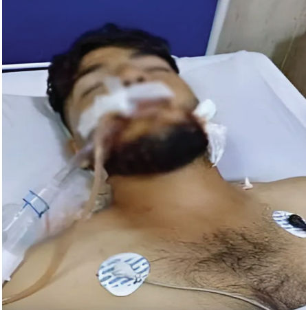
جرحى عراقيين في مستشفى في عفرين.