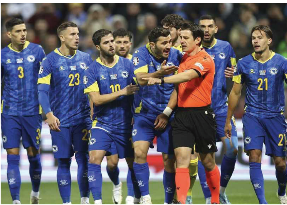
لاعبون من المنتخب القطري يتنازعون مع الحكم الدولي

قبل انطلاق العرس الكروي الأوروبي في ألمانيا يورو 2024، قررت لجنة الحكام في (يويفا) أن يكون كابتن المنتخب فقط هو المخوّل الوحيد في النقاش مع الحكم في قرار يتخذه في المباراة، ولكن ماذا لو طبقنا هذا القرار في بطولات مقاطعة الجزيرة لكرة القدم