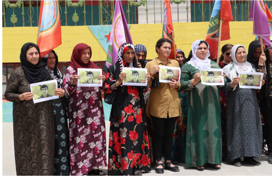
الكريلا شريان كردستان النابض

على حركة الحرية الكردستانية، كاستخدامهاها الأسلحة الكيماوية الممنوعة دولياً، والإعدامات الميدانية بحق الشباب والنشيان في إيران، فيسجل الدولة الإيرانية بتصدر قائمة دول العالم من حيث الانتهاكات لحقوق الإنسان والمعطلين السياسيين وأسرى الحرب، وخاصة الكرد،