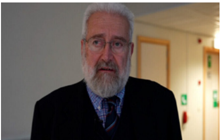
حول ذلك خُذت. لوكاله فرات للأنياب

مركز الأخبار ـ أشار المحامي الإيطالي الشهير إزيو منزيون، إلى أن العزلة على المفكر عبد الله أوجلان، لا مثيل لها في العالم أجمع، وأشار إلى أن على اللجنة الأوروبية لمناهضة التعذيب السعي الجاد لرفعها.